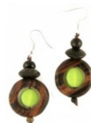
Boucles d'Oreilles Pâte...